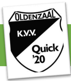
Finn, 14 jaar KVV Quick 20' Oldenzaal

Dat het niet erg is om foutjes te maken. Je wordt er juist beter door. Het was wel heel fijn dat onze stagebegeleiders heel aardig waren. Ook weten we nu heel goed dat je er echt leuk uit kan zien met tweedehands kleren. Ook nog beter voor het milieu!