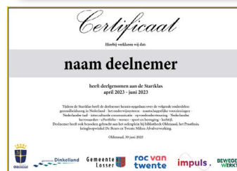
De Startklas wordt afgerond met de uitreiking van een certificaat van deelname.